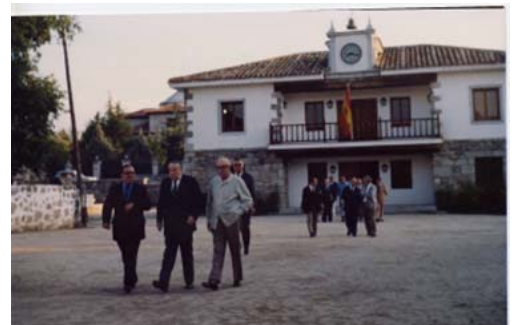
1974. Corporación municipal con el Gobernador Civil en su visita al municipio

Pasada la Guerra y hasta llegar a los ayuntamientos democráticos de 1979, tal como hoy los conocemos, la norma local de más trascendencia será la de 1955, a medio camino entre la centralista de 1877 y el Estatuto de 1924 o la Ley de 1935, autonomistas, volviéndose a depender del Gobierno Civil, quien controlará el nombramiento del alcalde, fiscalizando la vida municipal.