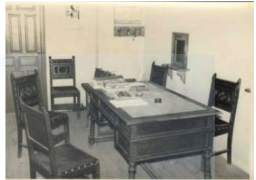
1971. Oficina (ventanilla) de atención al público

En el segundo tercio del siglo XIX, una vez eliminado el Antiguo Régimen, liberales o absolutistas, progresistas o conservadores, marcarán la vida municipal como consecuencia de sus distintas políticas. Los Ayuntamientos serán autónomos o quedarán subordinados en lo político al Gobernador Civil; los cargos serán gratuitos, honoríficos y obligatorios; los presupuestos publicitados y las sesiones plenarias públicas o de acceso restringido, por épocas y turnos políticos.