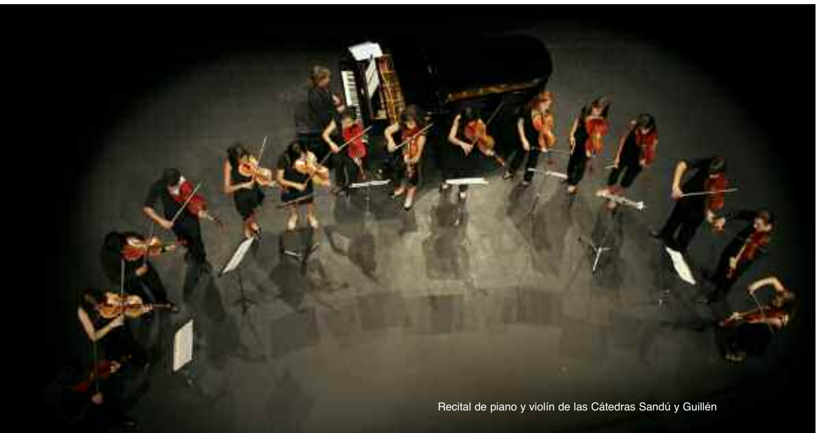
Recital de piano y violín de las Cátedras Sandú y Guillén

Los más prestigiosos maestros del panorama internacional han compartido diez días con una selección de los 125 alumnos más destacados, venidos desde 15 países distintos. Diez jornadas en las que la Casa de Cultura de Torrelodones se convirtió en una especie de caja musical en la que las notas de violas, violoncellos, violines, guitarras y pianos tomaron sus aulas para componer una serie de clases magistrales en una sinfonía de intercambio de conocimientos.