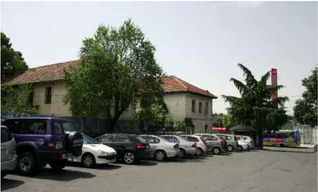
Parcela del antiguo Bar Gabriel, frente a la estación de RENFE

podrán llevarse a cabo a partir de ahora en la Colonia, como consecuencia de las modificaciones urbanísticas aprobadas en la última sesión plenaria.