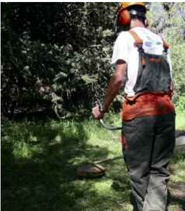
Desbroce en el entorno de Los Peñascales

En cuanto a las materias en las que se prepararán a los alumnos, y en las que trabajarán de manera práctica, una vez superado el periodo teórico, serán podas y tratamientos fitosanitarios en parques y jardines; instalación de sistemas de riego y drenajes, xerojardinería, creación y mejora de zonas verdes y conservación de especies forestales, ríos, dehesas y caminos rurales. Para llevar adelante el proyecto, el Ayuntamiento destinará un presupuesto de 450.681 euros.