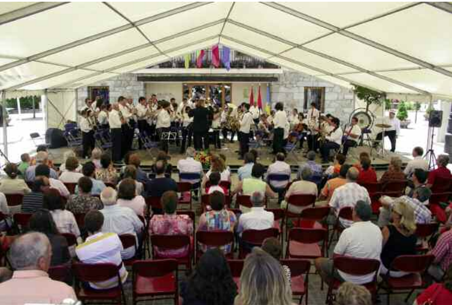
Agrupación formada por miembros de todas las bandas municipales participantes