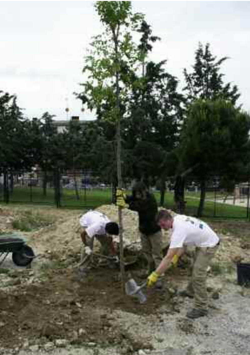
Plantación del Día Mundial del Medio Ambiente en Los Altos del Club de Campo.