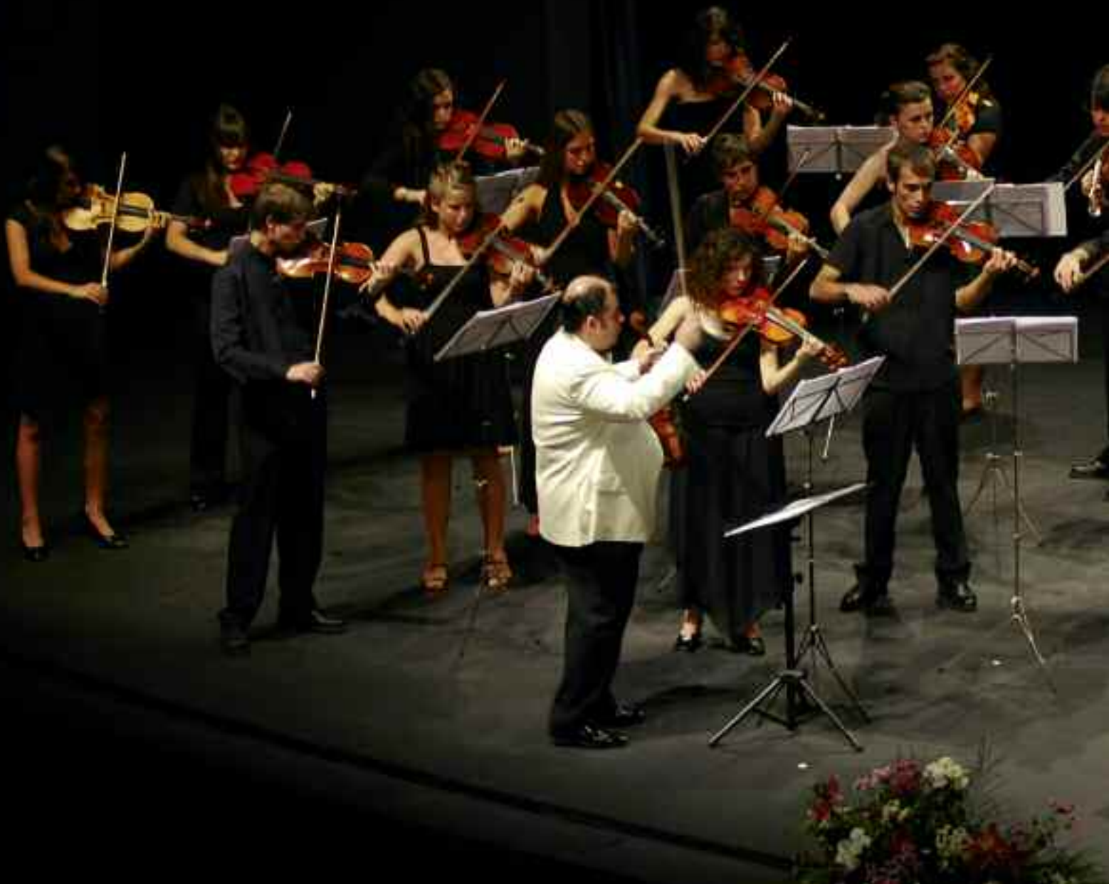
Recital de la Camerata del Forum