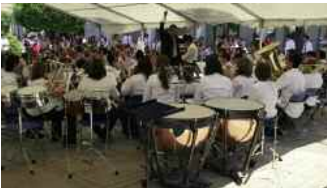
Banda Sinfónica Municipal de Torrelodones

Numerosos vecinos se congregaron en la Plaza de la Constitución para asistir al I Encuentro de Bandas Municipales en Torrelodones, en el que participaron las agrupaciones musicales de las localidades de Alpedrete, Majadahonda, Villanueva de San Carlos, Granátula de Calatrava y la afritriona, Torrelodones. Todas ellas arrancaron grandes aplausos, especialmente la actuación final, en la que intervinieron miembros de todas las bandas asistentes, que interpretaron el Himno de España.