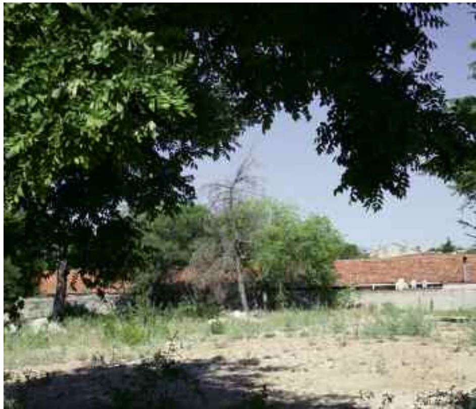
Parcela de la calle Jesusa Lara, esquina a Paseo de Vergara

Nuevamente, se resolverá así la carencia de plazas de aparcamiento y se habilitarán espacios peatonales y zonas verdes públicas. Pero además, la modificación prevé el retranqueo de la parcela en cuestión, por lo que se ampliarán las aceras, mejorando la movilidad urbana y la circulación.