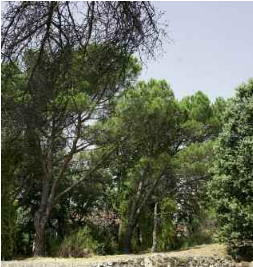
Jardín catalogado de Villa Rosita

Por último, en la finca conocida como Villa Rosita, en las proximidades de la estación, se ha modificado el planeamiento, que permitía la construcción de chalés independientes, estableciéndose el desarrollo mediante adosados.