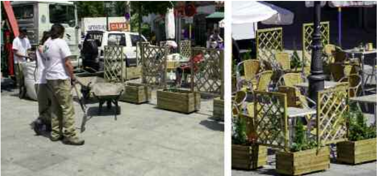
Instalación de jardineras y cerramiento de las terrazas de la Plaza de la Constitución.