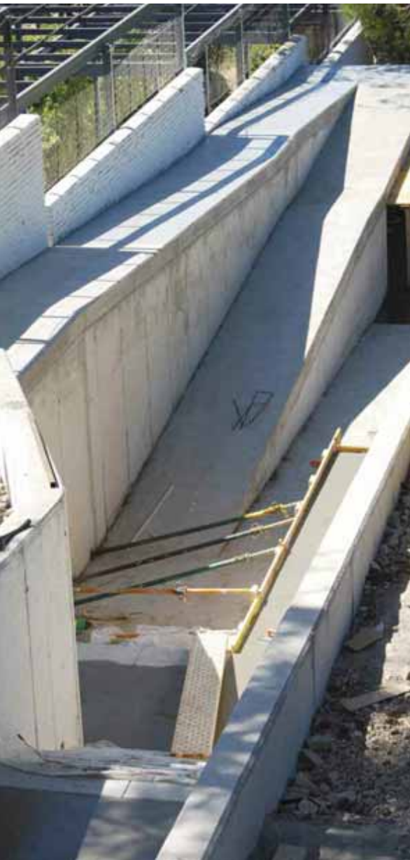
Eliminación barreras arquitectónicas Torreforum