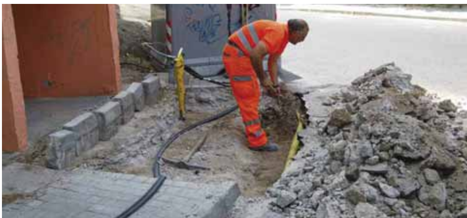
Calle Zoilo González