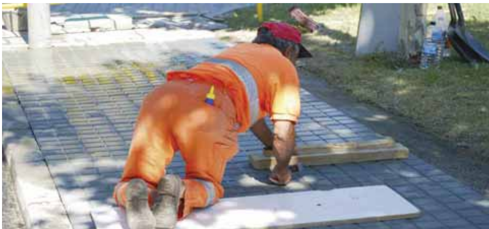
Carretera de Torreldones