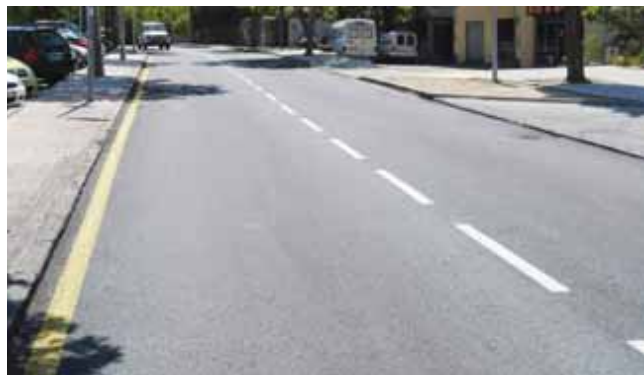
Asfaltado Calle Jesusa Lara