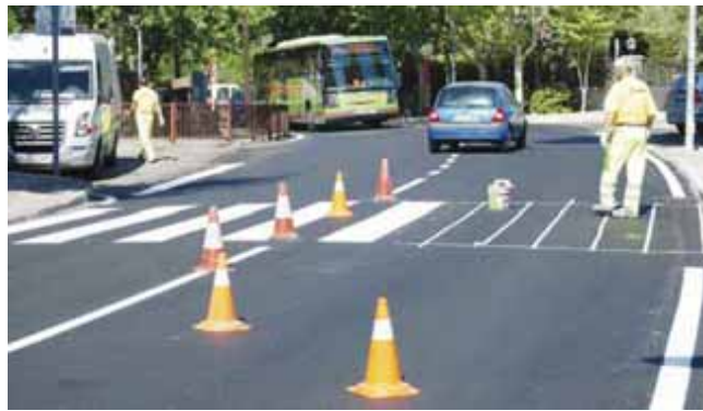
Asfaltado y señalización Carretera de Torredones