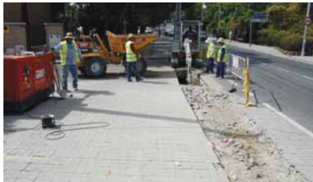
Saneamiento Carretera Hoyo Manzanares