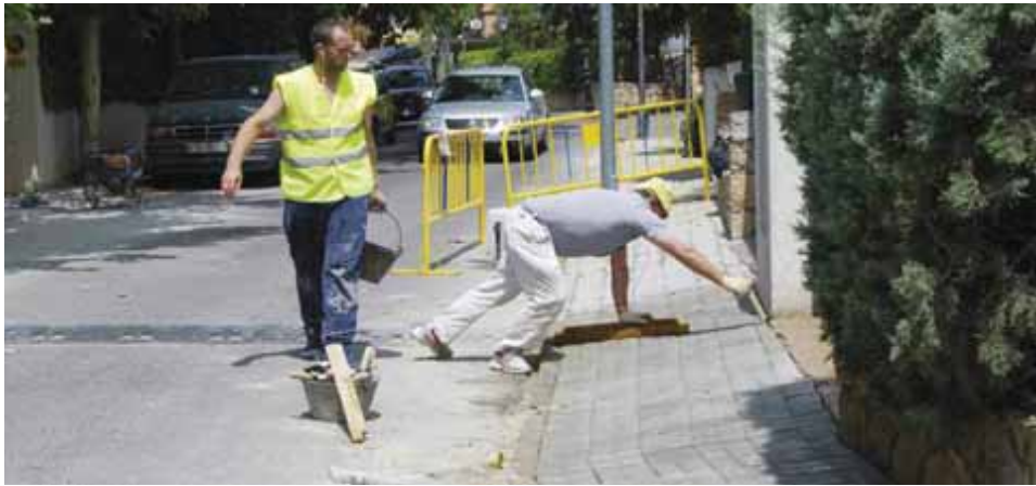
Calle José María Moreno