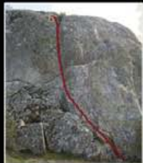
LA ROCA DE LUPO