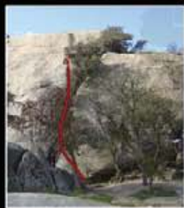
GRIETA LA JUANA