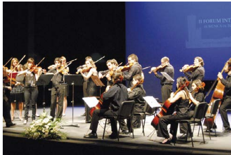
Este año se ampliará el número de componentes de la camerata, que se convertirá en la Orquesta Clásica Forum Internacional de Torreldones.