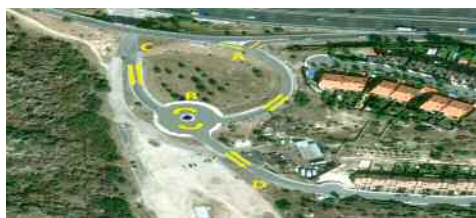
A: Salida hacia A6 dirección Madrid B: Rotonda de Gestión del tráfico C y D: Incorporación y salida del pueblo y Bomberos

2- Instar al Ministerio de Fomento la construcción de una plataforma elevada desde el final del actual puente hasta pasada la salida de Bomberos dirección Madrid.