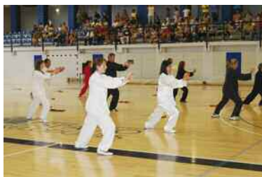
cejal de Deportes.

Los deportes que participaron fueron: Tai-Chi, disciplina en la que los alumnos junto a su profesor hicieron una exhibición de este elegante deporte. Las par-