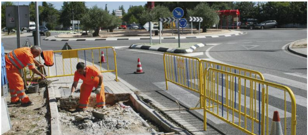
Acerado en la Avenida Conde las Almenas y eliminación de barreras arquitectónicas