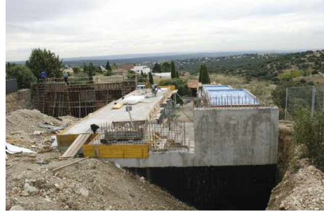
Obras de ampliación de cementerio y el tanatorio municipal