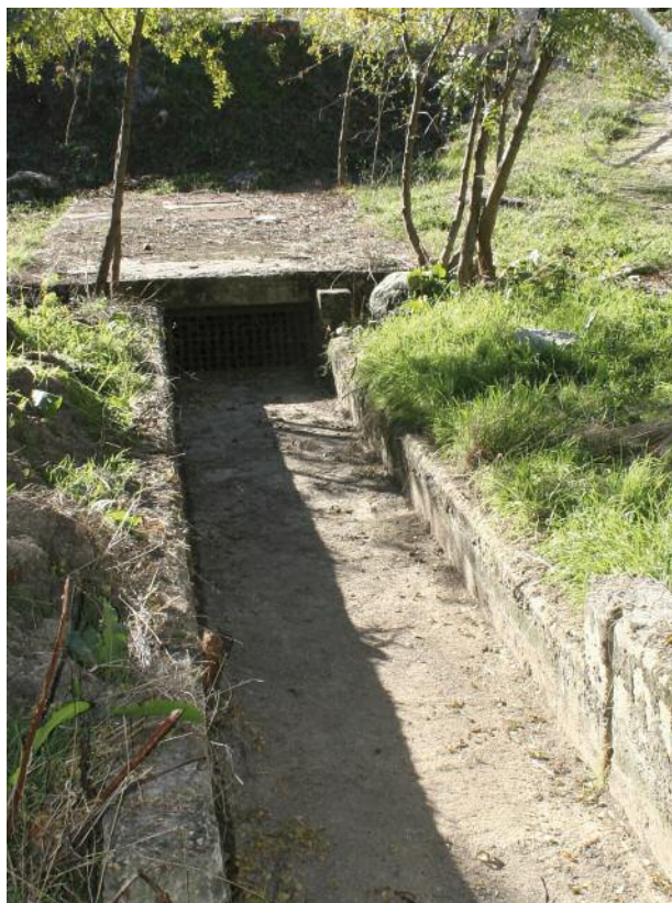
Tras las abundantes lluvias del pasado año había quedado obstruido por residuos vegetales, produciendo el estancamiento del agua, como se observa en la fotografía de la izquierda, cuestión ya solventada, como se observa en la imagen de la derecha.

obstruido por residuos vegetales, produciendo el estancamiento del agua. Las principales tareas que se están llevando a cabo son el desbroce de los márgenes de maleza, la poda y talado de aquellos árboles que lo requerían, como consecuencia de su deterioro, así como la limpieza de la basura en la zona (plásticos, mesas, botellas, sillas, hierros...) consecuencia de la actitud incívica de algunos vecinos.