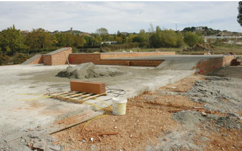
El skate park, ubicado en Pradogrande, ocupará una superficie de más de 1.500 m 2 y dispondrá de varias plataformas y rampas con diferentes niveles.

Por otro lado, continúan avanzando los trabajos del resto de los proyectos incluidos en el PRISMA, como se observa en las fotografías.