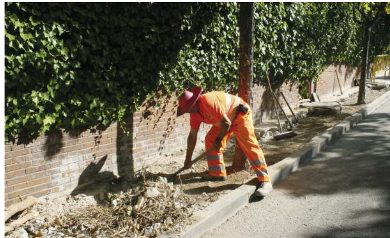
Acerado en la calle Pintor Botí