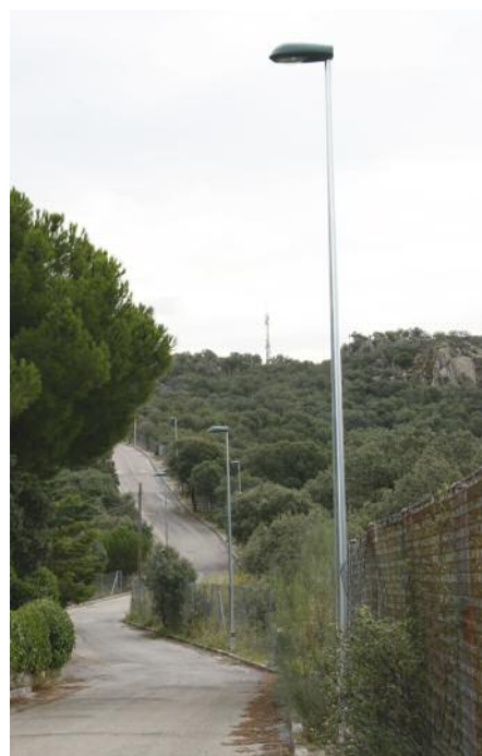
Alumbrado en las urbanizaciones Arroyo de Trofas y La Berzosilla

Además, está pendiente la adjudicación de las obras de la Casa de Cultura y la Casa de Juventud. en cuanto al proyecto para cubrir la pista polideportiva del instituto, se encuentra en redacción.