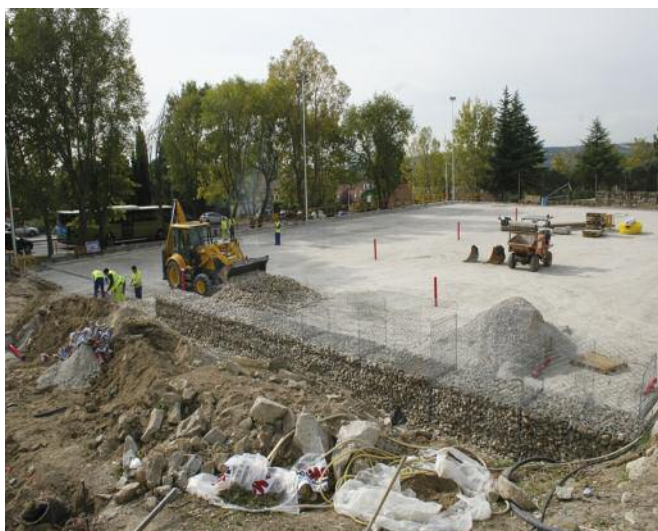
La nueva zona deportiva en el entorno de Torreforum contará con dos campos de mini fútbol, convertibles en uno de fútbol 7, y una zona destinada a aparcamiento para 13 vehículos.